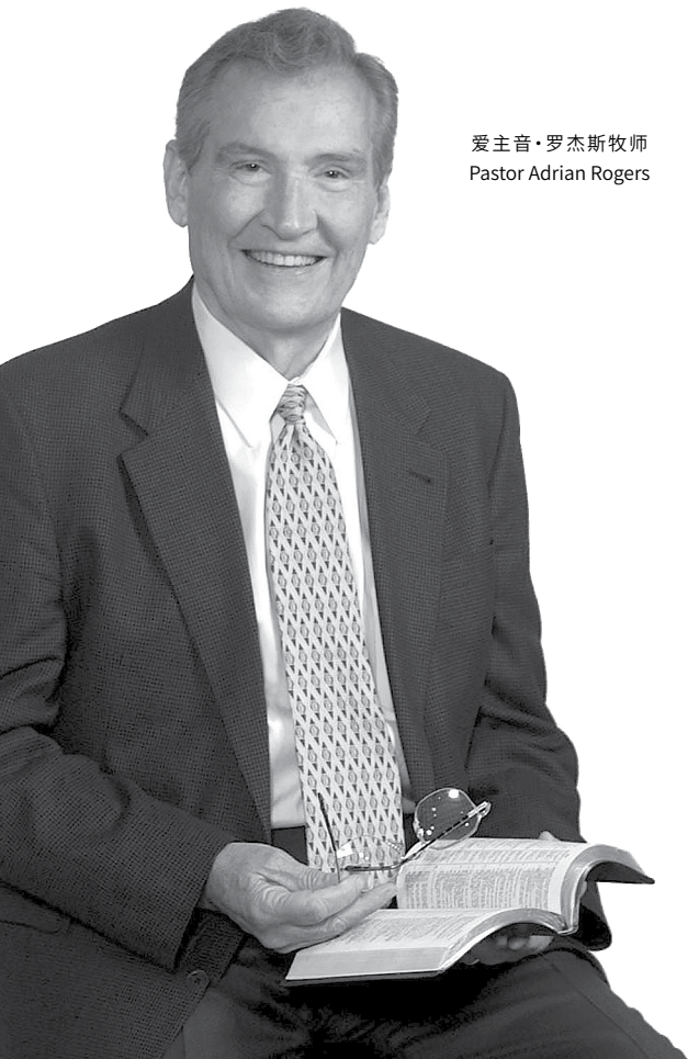
爱主音·罗杰斯牧师 Pastor Adrian Rogers